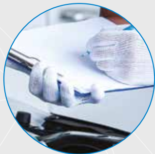
Gestione della conformità