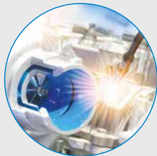
Efficienza dei processi