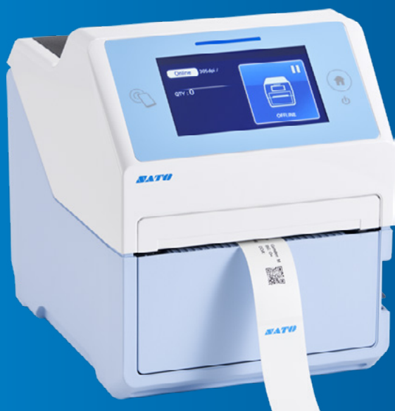
Drukarka SATO CT4-LX-HC Rekomendowane do drukowania opasek SATO TT