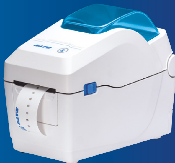
Drukarka SATO WS2 Zalecana do drukowania opasek DT SATO

Wszystkie informacje zawarte w tej ulotce są aktualne na dzień 2022 marca. Dane techniczne produktów mogą ulec zmianie bez powiadomienia. Nieupoważnione kopiowanie zawartości niniejszej ulotki, w części lub w całości, jest surowo zabronione. Wszelkie inne nazwy oprogramowania, produktów lub firm są znakami towarowymi lub zastrzeżonymi znakami towarowymi ich właścicieli.