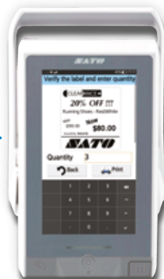
Önizlemeyi Kontrol Edin ve Adedi Girin